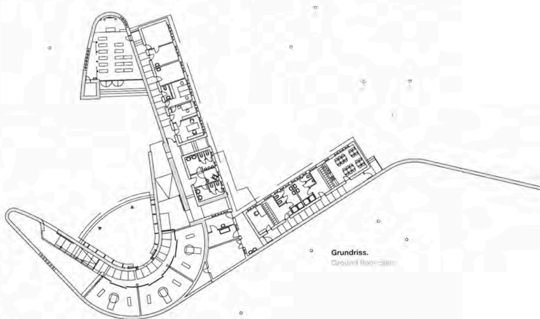
Grundriss. Ground floor plan

Since the capacity of the existing cemeteries in Požega, a city in Croatia of 20,000 inhabitants and the seat of a Catholic diocese, has been exhausted and it is not possible to make any extensions, a new burial ground has been opened in the plain on the southern edge of the city. It is defined by a spatial form made of straight and undulating brick walls, thus being protected and yet open in free landscape at the same time.